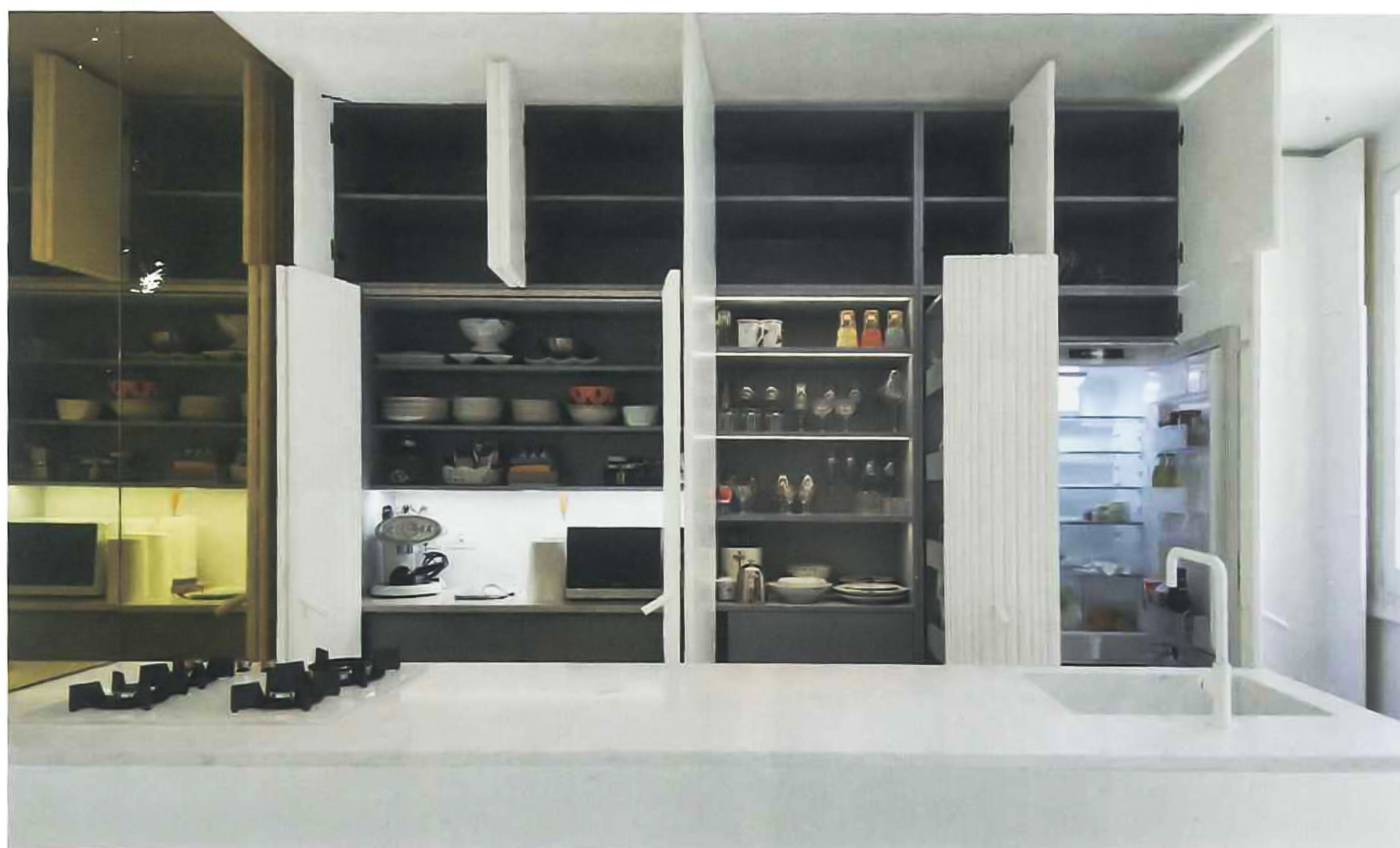
L'armadiatura della cucina si apre con ante a pacchetto, a battente e con un elemento-dispensa scorrevole. È dotato di zona lavoro, colonna a credenza e frigocongelatore The cabinet has folding doors, hinged doors and one sliding door larder element. It also has a light-filled work area, a dresser unit and a fridge-freezer